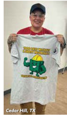
Cedar Hill, TX