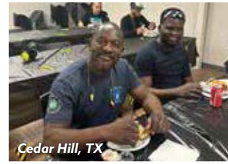
Cedar Hill, TX