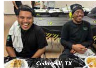
Cedar Hill, TX