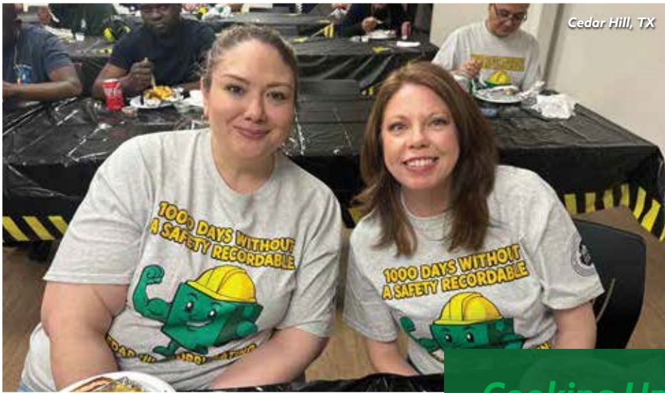
Cedar Hill, TX